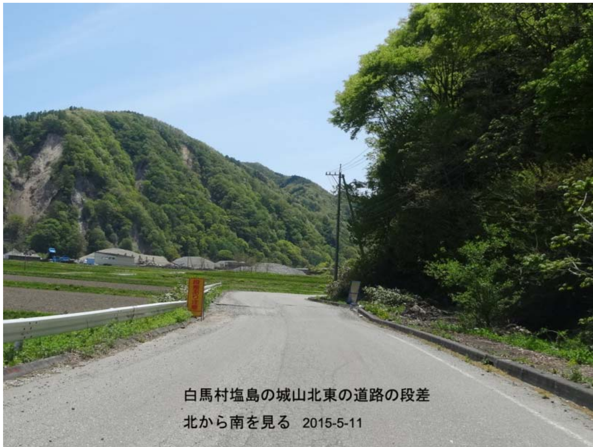
白馬村塩島の城山北東の道路の段差 北から南を見る 2015-5-11