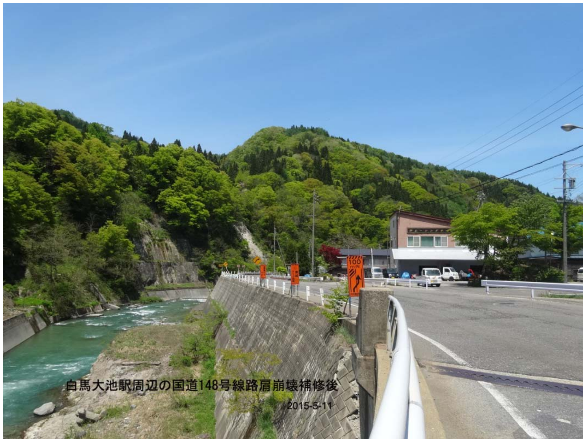
白馬大池駅周辺の国道148号線路肩崩壊補修後