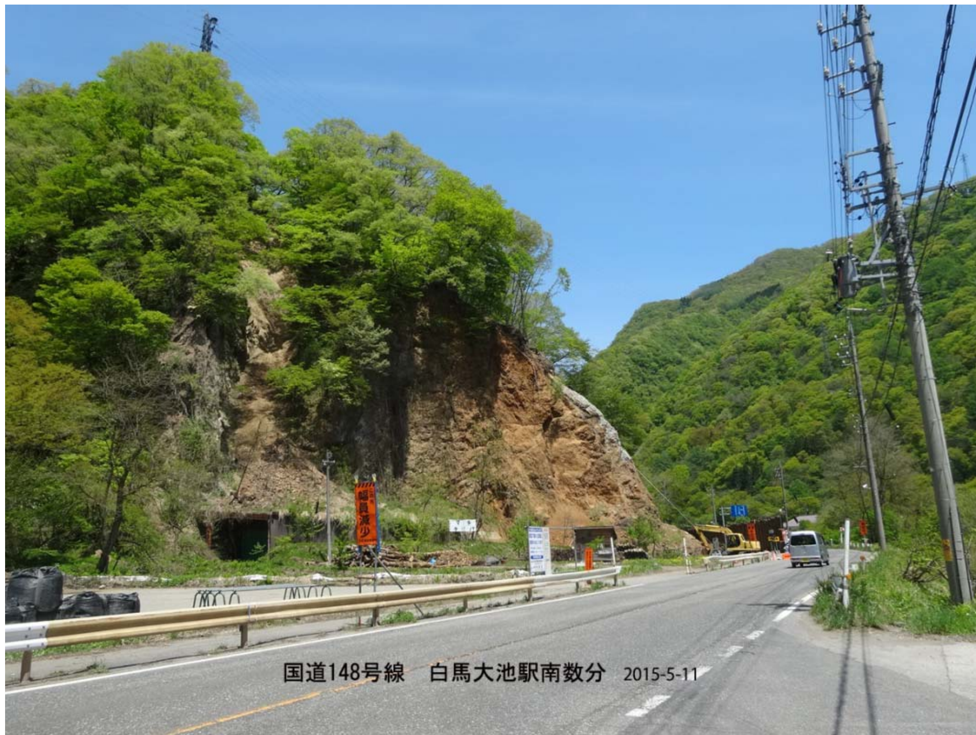
国道148号線 白馬大池駅南数分 2015-5-11