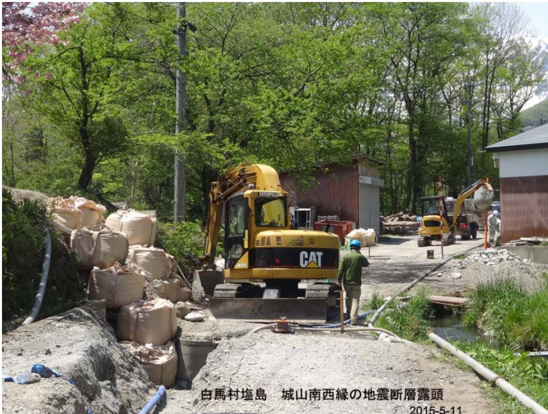
白馬村塩島 城山南西縁の地震断層露頭