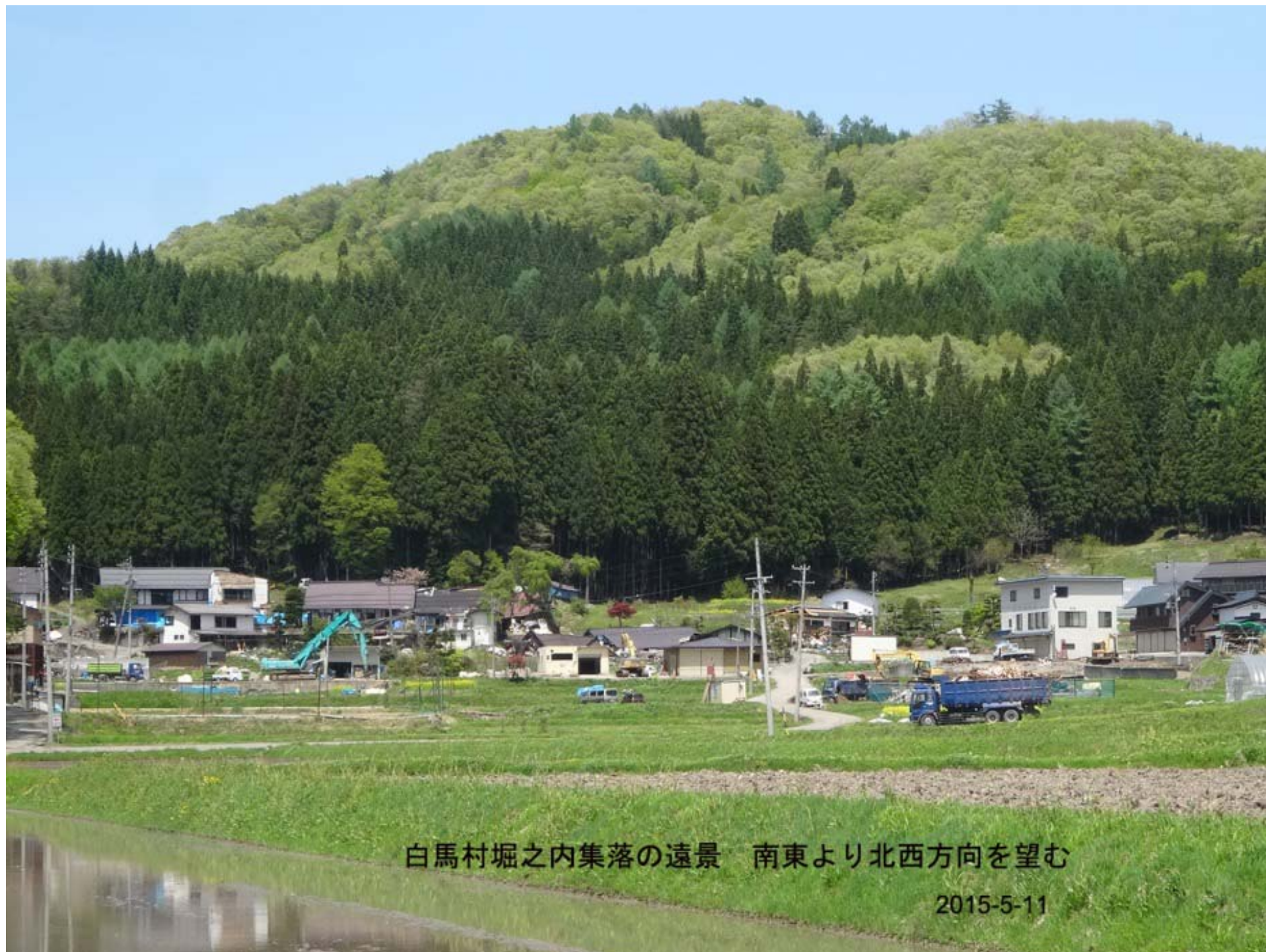
白馬村堀之内集落の遠景 南東より北西方向を望む