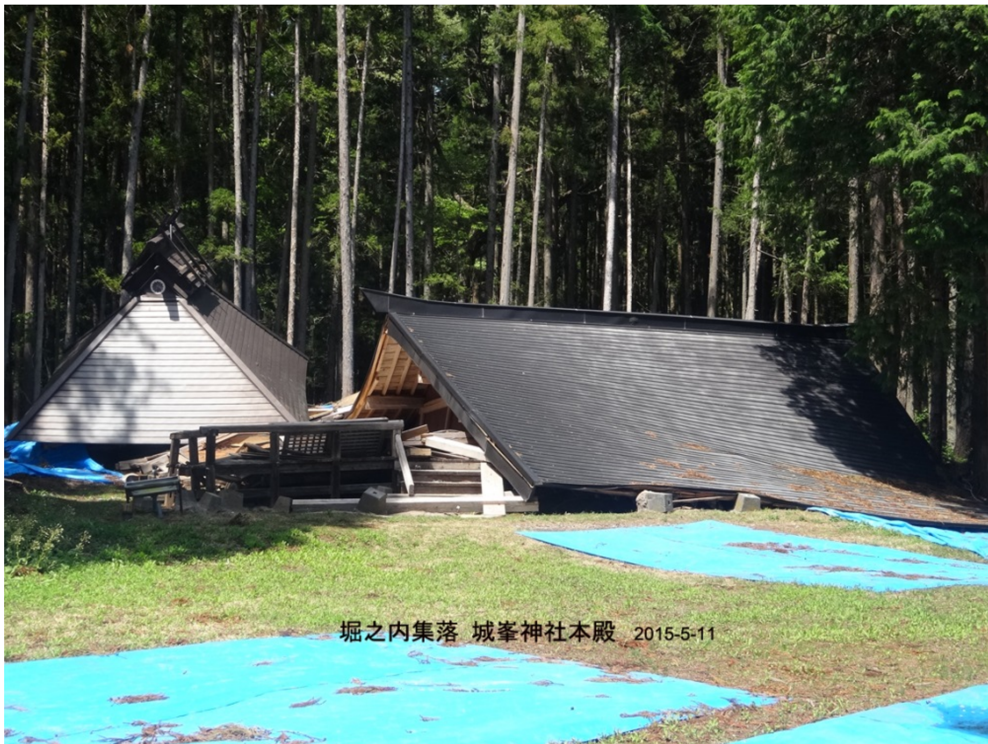
堀之内集落 城峯神社本殿 2015-5-11