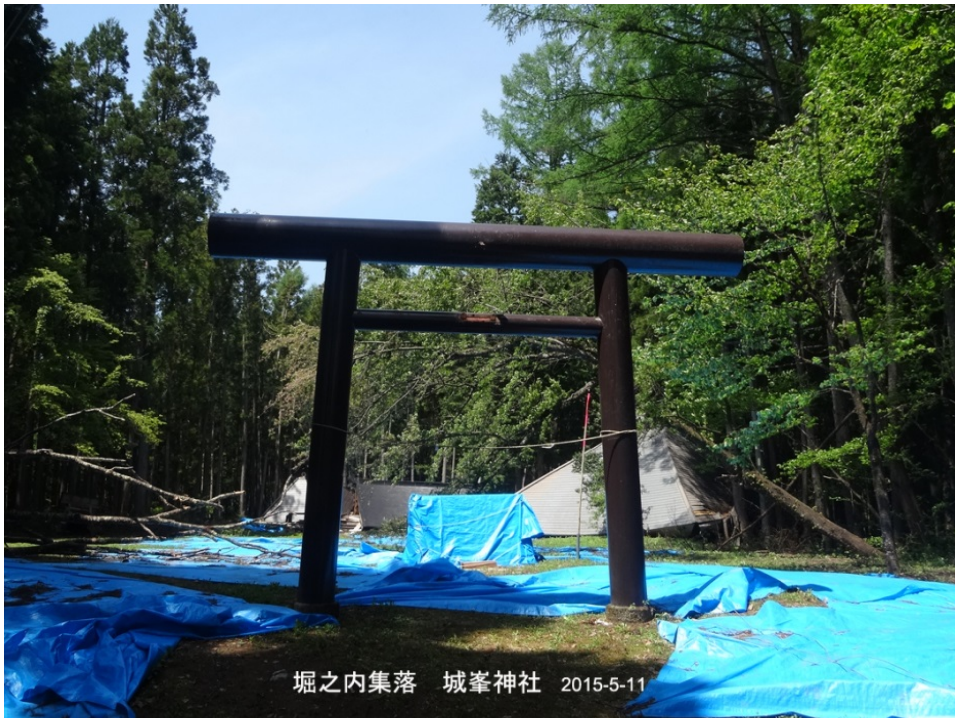
堀之内集落 城峯神社 2015-5-11