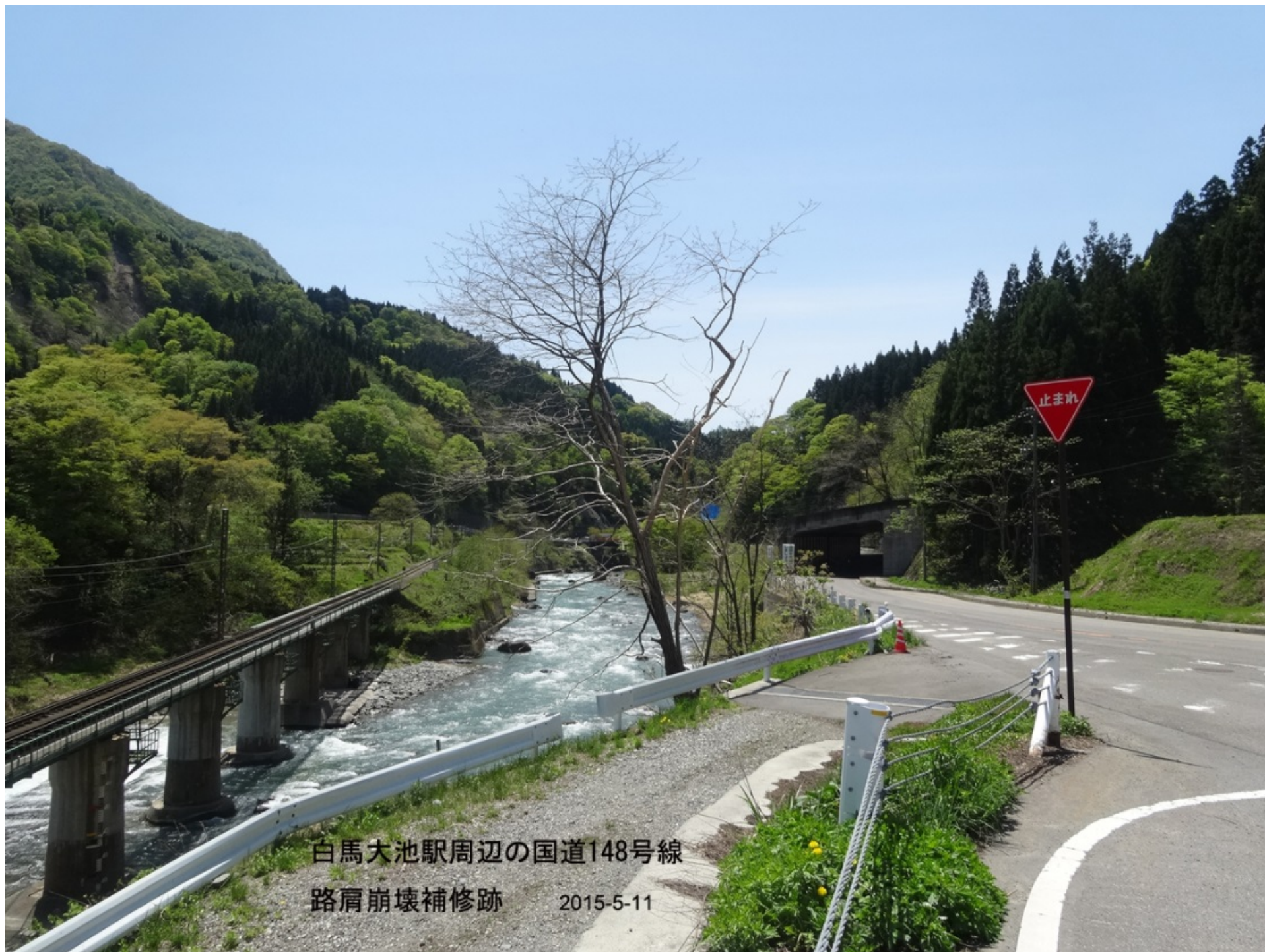
白馬大池駅周辺の国道148号線 路肩崩壊補修跡 2015-5-11