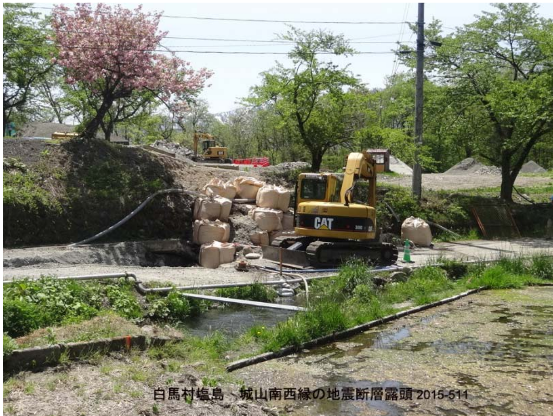
白馬村塩島、城山南西縁の地震断層露頭 2015-511