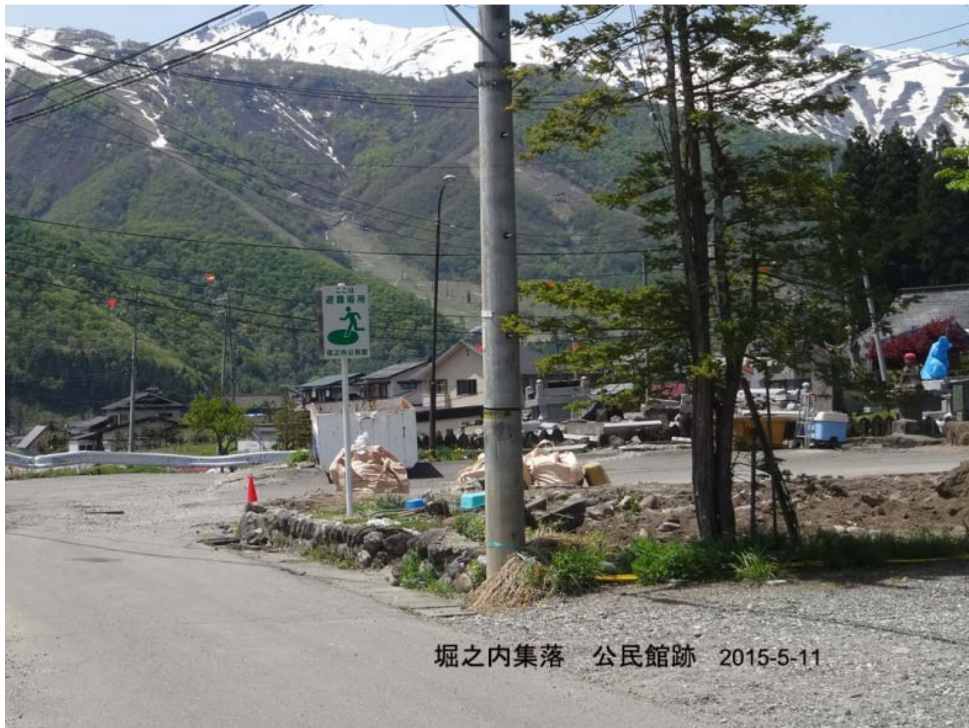
堀之内集落 公民館跡 2015-5-11