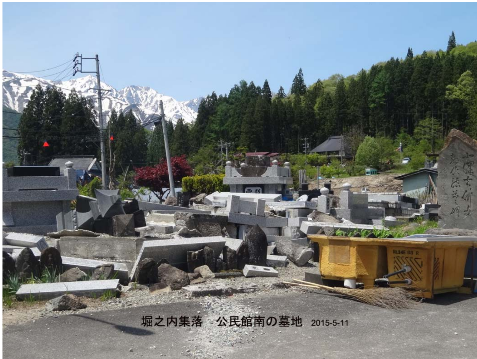
堀之内集落 公民館南の墓地 2015-5-11